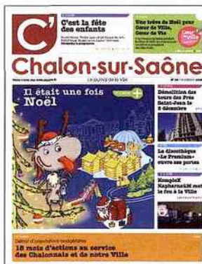
Grand prix 2009 de Cap'Com.

Cette année 2009 a été faste pour les journaux de Chalon-sur-Saône. Sur les 179 candidatures de journaux territoriaux reçues par le jury de Cap'Com, et sur les cinq prix attribués, la ville de Chalon a emporté deux fois la palme. Ainsi, le 3 décembre dernier, lors du forum annuel de Cap'Com, qui se tenait à Saint-Étienne, le 11 e grand prix de la presse territoriale a été attribué à la revue municipale mensuelle de la ville, C'Chalon , tandis que le 3 e prix est revenu à Grand Chalon Magazine , bimestriel