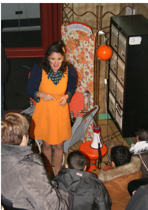
À Vendôme — Édition 2018