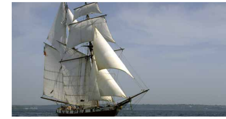
Avec de nombreux autres bateaux, La Recouvrance participera au « Tour en Rade ».

Le CKCB, le SNRK, l'Aviron Brestoïse et YCBI de S'Caes Elorn organisent une remontée de l'Elorn jusqu'à Landerneau, puis retour, le tout à la rames, avirons et pagaies (kayaks, aviron, SUP et Yole de Bantry...).