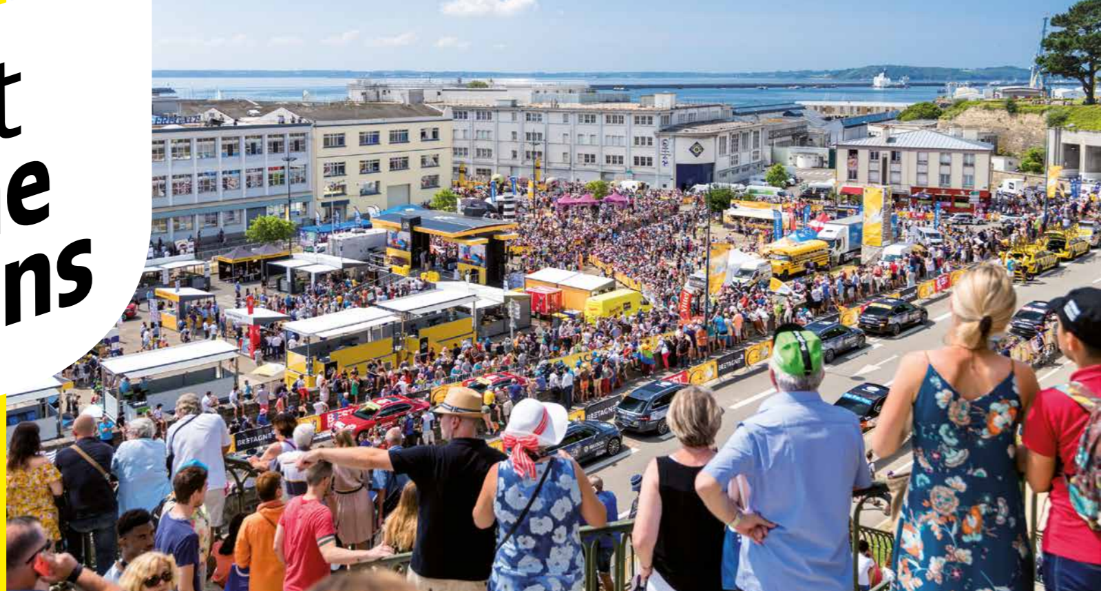
Le public au départ du Tour de France 2018 à Brest