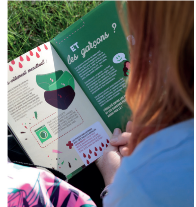
Michel JAUZAC / Département des Pyrénées-Orientales