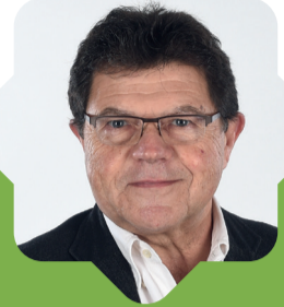
Le point de vue de MICHEL AIME

En partenariat avec le syndicat Beuve Bassane et du Ciron, la CdC veille à la qualité des cours d'eau et la préservation de leurs écosystèmes, en plus d'un entretien régulier du Lac de la Prade.