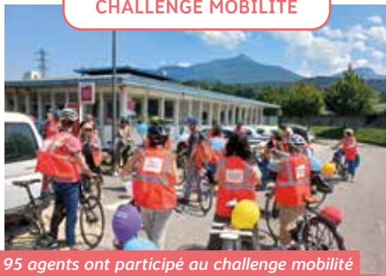
→ 95 agents ont participé au challenge mobilité le 1 er juin. Ainsi, 1128 kilomètres ont été parcourus autrement qu'en voiture individuelle. Le jour J, une trentaine de collègues sont allés en vélobus pique-niquer à la piscine du Stade. Objectif : se rendre compte qu'il est facile et rapide d'aller d'un site à l'autre de l'agglo à vélo.