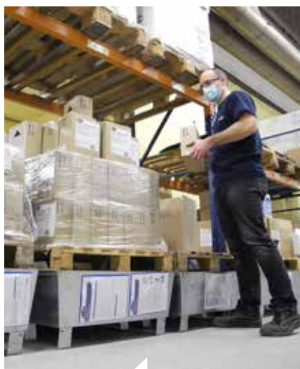
L'Acfi a préconisé des aménagements dans le magasin municipal comme la pose de bacs de rétention.

Il y a quelques années, le service a reçu la visite d'un Acfi, un agent chargé de la fonction d'inspection, diligenté par