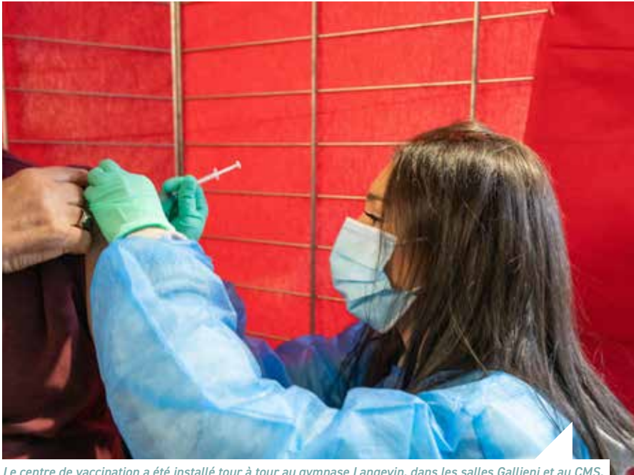
Le centre de vaccination a été installé tour à tour au gymnase Langevin, dans les salles Gallieni et au CMS.

Le centre de vaccination est ouvert depuis un an. La structure, montée en urgence pendant la crise sanitaire, s'est donc pérennisée.